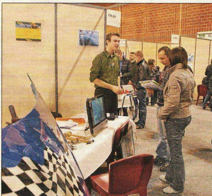
Cette année, 120 exposants seront amenés à rencontrer environ 5 000 demandeurs d'emploi, sur toute une journée.

Deux espaces spécialisés sont à l'honneur : le village transfrontalier, et les ateliers de création d'entreprise. L'emploi transfrontalier attire de plus en plus : le village propose donc « un approfondissement de la connaissance du néerlandais », mais aussi des conseils. « On a connu récemment une modification du statut du travailleur transfrontalier. Il y a un besoin d'information juridique sur ces questions », explique l'élu. L'espace « création d'entreprise » fait suite